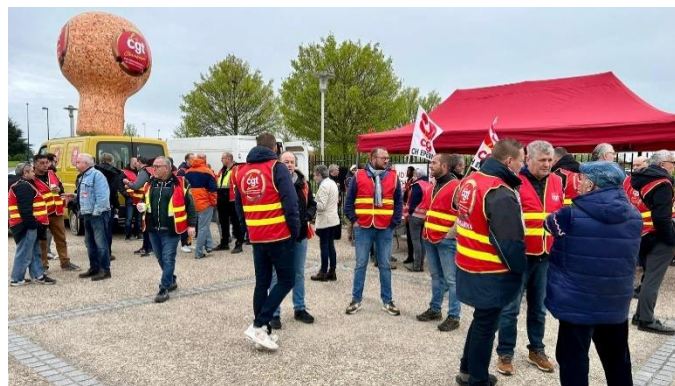
L'intersyndicat CGT du champagne aux 120 ans du Syndicat Général des Vignerons

Pour toutes ces raisons la CGT ne souhaite pas accorder un blanc-seing aux patrons de la filière et s'oppose à ces dérogations systématiques en Champagne pour ces salariés saisonniers.