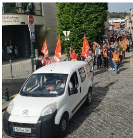
Manifestation à Épernay

Les droits sociaux sont dans le collimateur et les manifestants ont bien compris qu'à l'automne, une fois passés les élections européennes et les Jeux Olympiques, le gouvernement a bien l'intention de lancer sa réforme de la fonction