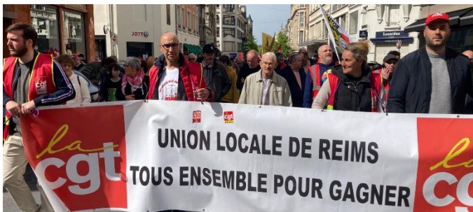
Les salariés de Brinks Towing System fiers de leur récente victoire, à la manifestation de Reims

L'actualité internationale s'est aussi invitée dans les cortèges, nombre de manifestants, en particulier les jeunes, dénonçant l'inertie de la communauté internationale face au massacre en cours à Gaza et exigeant un cessez-le-feu immédiat.