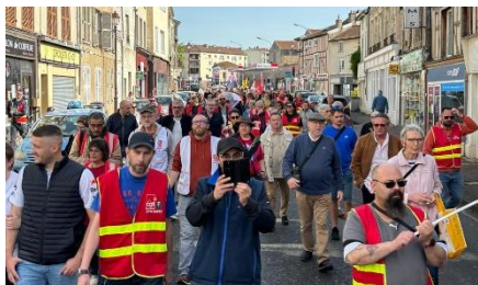
Manifestation à Châlons-en-Champagne

c'est une mobilisation importante, en dépit d'un calendrier scolaire peu favorable. Nous étions 500 à Reims, 150 à Châlons-en-Champagne, 100 à Épernay et 50 à Vitry le François.